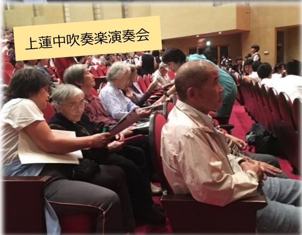
上蓮中吹奏楽演奏会