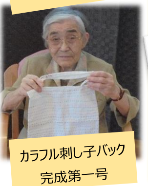
カラフル刺し子バック 完成第一号