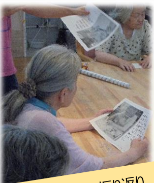
写真で今日の振り返り をしています