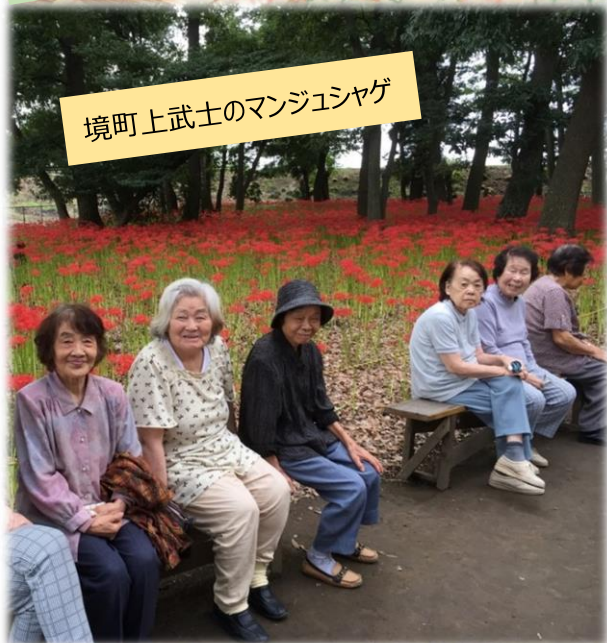
境町上武士のマンジュシャゲ