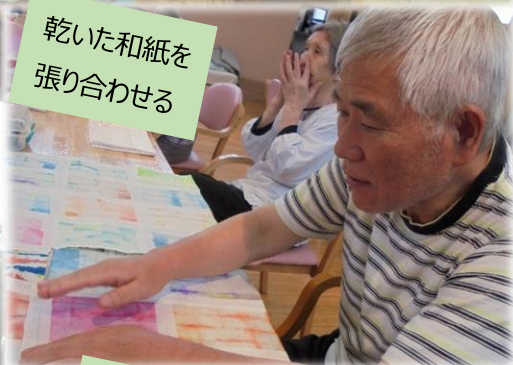
乾いた和紙を 張り合わせる