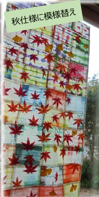
秋仕様に模様替え