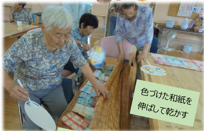
色づけた和紙を 伸ばして乾かす

今号から紙面をリニューアルしました。季節のおやつ、お口のケアのお話、認知症ケアのお話と、皆様のお役に立てるお便りになるよう、情報盛りだくさんでお送りいたします♪